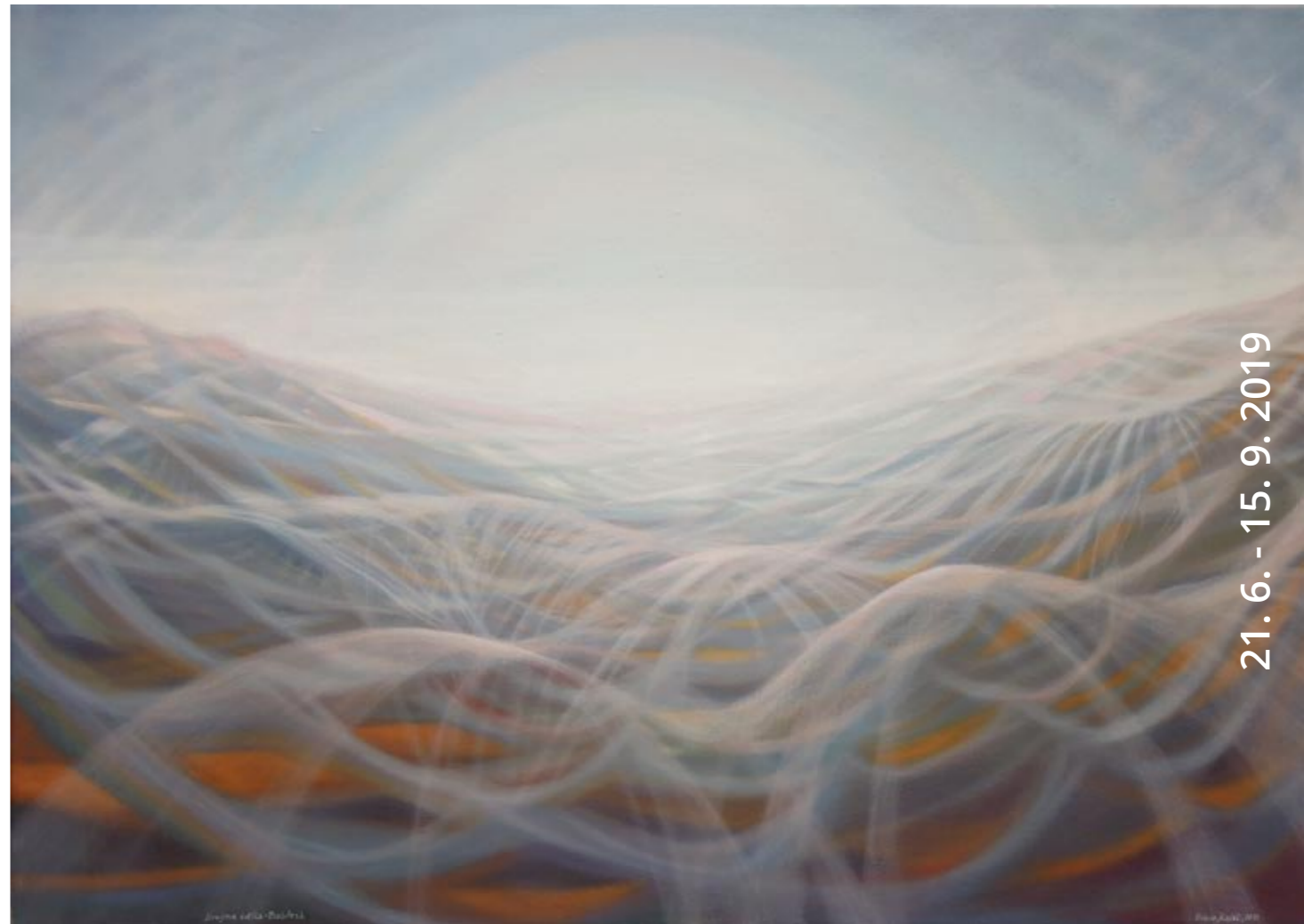
Krajina světla, 2015 Olej na plátně 70×100 cm

II. patro Kolowratského zámku v Rychnově nad Kněžnou